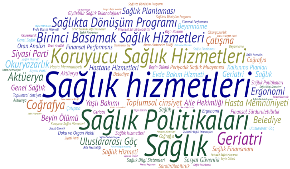
Şekil 3 Tezlerde Kullanılan Anahtar Kelimeler

Tezlerde yer alan anahtar kelimeler kelime bulutu ile görselleştirilmiştir. Buna göre sağlık hizmetleri, koruyucu sağlık hizmetleri, sağlık politikaları, sağlık, sağlıkta dönüşüm programı kelimelerinin ilk sıralarda yer aldığı belirlenmiştir.