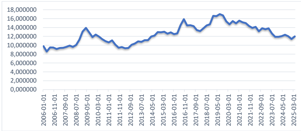
Şekil 3 Türkiye'de 15-64 Yaş Aralığındaki Kadın İşsizlik Oranı

Şekil 3'te görüldüğü gibi kadın işsizlik oranı 2006 yılında %9,76 iken ekonomik gerilemenin yaşandığı 2009 yılının ilk çeyreğinde %13,90 ve 2019 döneminin üçüncü çeyreğinde %17,01 oranına kadar ulaşmıştır. Kadın işsizlik oranı 2006 yılından 2019 yılına dek artış trendini korumuştur.